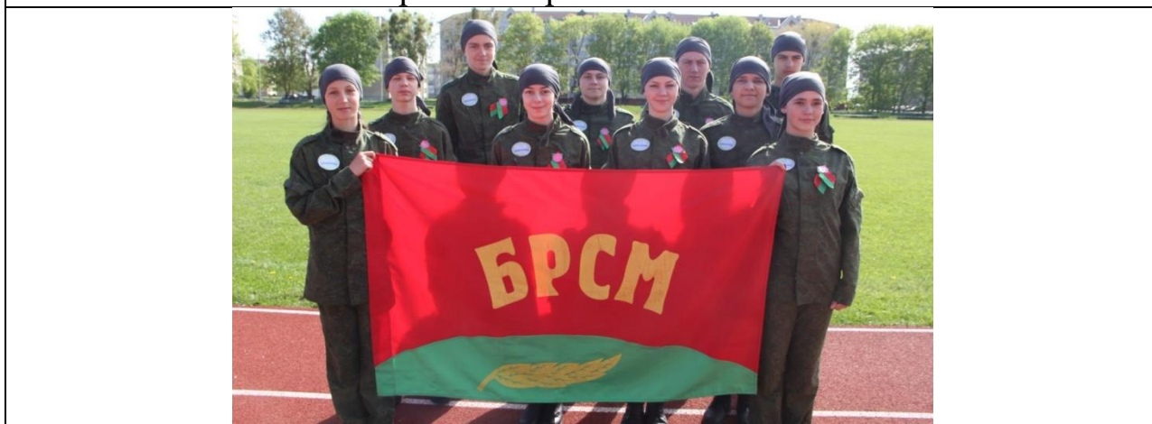
Победители районной игры "Миротворец" в рамках военно-патриотической игры "Орлёнок" - команда Жеребковичской СШ