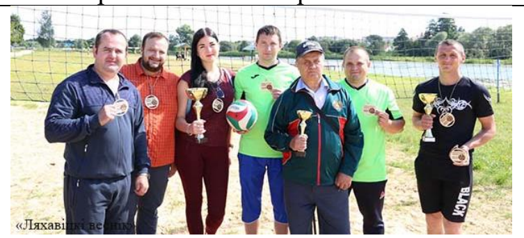
Лишь небольшая часть наград спортсменов аг.Жеребковичи

Работниками учреждений образования, культуры и другими заинтересованными проводится работа по выполнению мероприятий Комплекса дополнительных мероприятий, направленных на профилактику наркомании в подростковой и молодёжной Ляховичского района; выполнению мероприятий Комплексного плана совместных мероприятий по профилактике безнадзорности, преступлений и правонарушений, пьянства, наркомании и токсикомании среди несовершеннолетних, семейного неблагополучия; выполнению Комплекса мероприятий по предотвращению распространения алкоголя, наркотических и психотропных веществ; выполнению Комплексного плана совместных мероприятий, направленных на принятие эффективных мер по противодействию незаконному обороту наркотиков, профилактике их потребления, в том числе среди детей и молодежи, социальной реабилитации лиц, больных наркоманией.