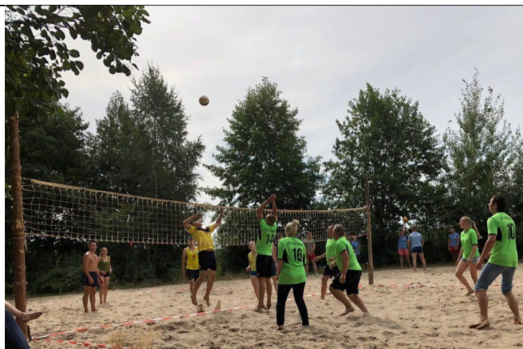
На соревнованиях по пляжному волейболу работники аг.Жеребковичи