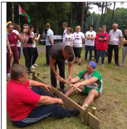
Наши на традиционном туристическом слете