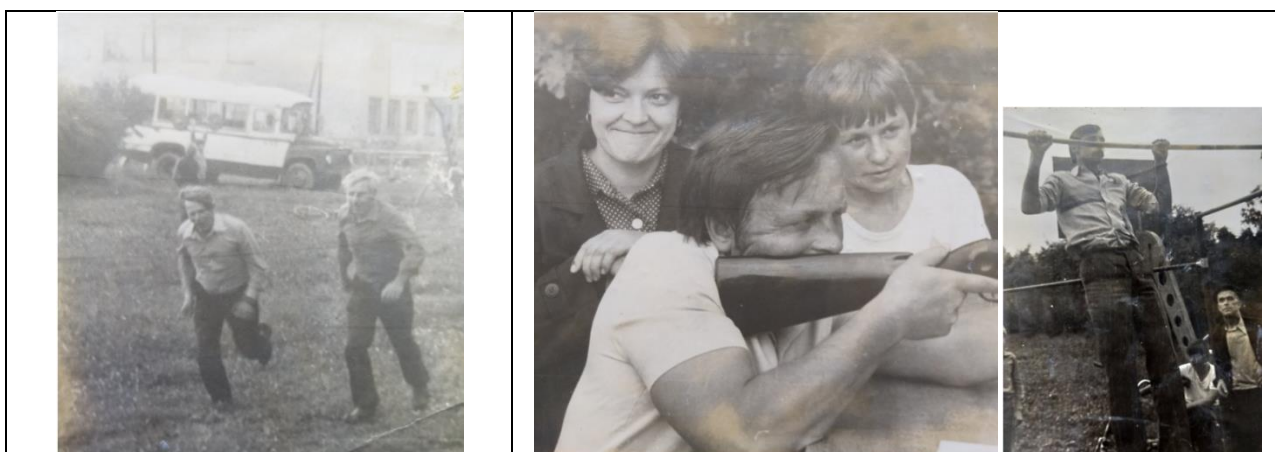
День деревни Жеребковичи

Для осуществления этих целей в аг. Жеребковичи проводится огромная физкультурно-оздоровительная работа по укреплению здоровья работающих. На высоком уровне находится спортивная работа. Такие мероприятия как "День деревни" не обходятся без спортивных мероприятий, а спортсмены аг.Жеребковичи всегда лидируют в районных соревнованиях по пляжному волейболу, мини-футболу, теннису, шахматах, туристических слётах.