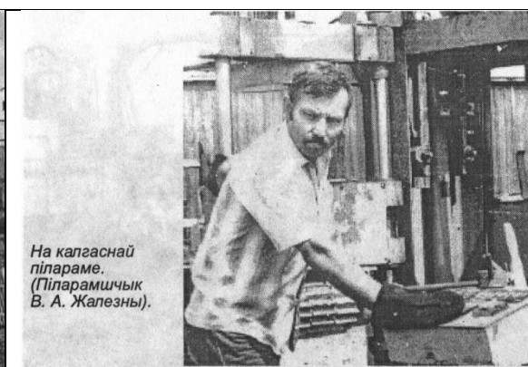
На калгаснай пілараме. (Піларамічык В. А. Жалезны).