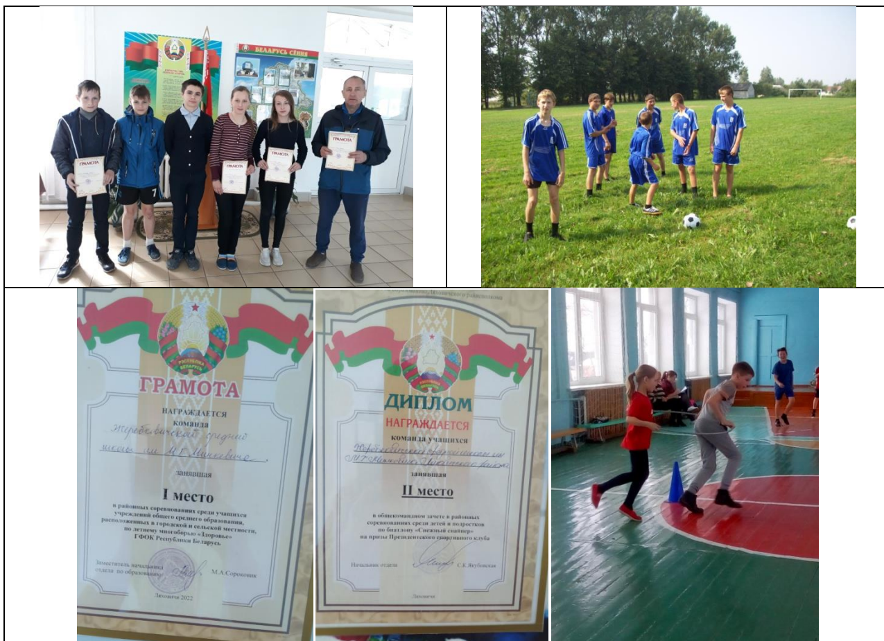
Из архива Жеребковичской СШ

Жеребковичской СШ периодически работает летний оздоровительный лагерь «Солнышко». Налажена работа с детьми во внеурочное время, на базе школы функционируют объединения по интересам: ЮИД, танцевальный, вокальный, "Мы - информатики". В субботний школьный день проводится физкультурно-оздоровительная работа во внеучебное время. Спортсмены школы под руководством учителя физического воспитания регулярно занимают призовые места на районных и также областных соревнованиях.